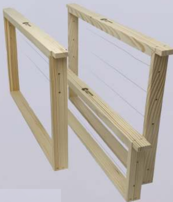
Details Nut, Hülse und Ohr

Holzrahmen aus Schweizer Tannenholz/Weymouthse, geklammert, mit einer Rahmenbreite von 28 mm (bei Drohnenrahmen 33 mm), alle Rahmen haben eine Ohrenbreite von 25 mm, die Rahmen sind horizontal mit Edelstahldraht gedrahtet und mit Hülse verstärkt.